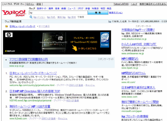
[検索結果画面に動画やカタログ映像が表示]