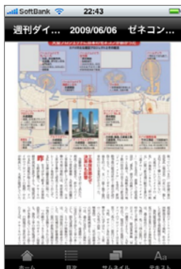
1 ページを表示した場合