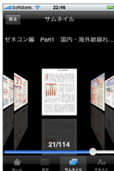
サムネイルボタンを押した場合