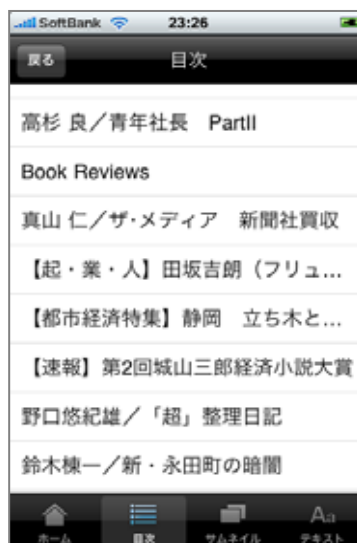
目次ボタンを押した場合