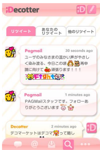
(図1：タイムライン画面)