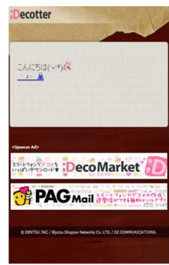
(図3：非対応端末表示画面)