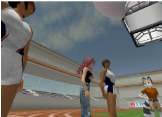
100m 走のスタート直前の風景 (様々なアバターが競技に参加できる)