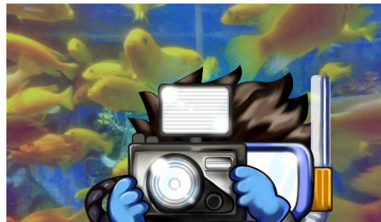
アイテムサーチ時の画面