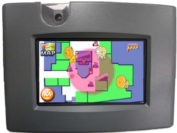
基本散策(通常マップ)画面