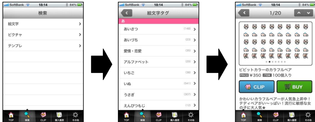
<パッケージ一覧 画面イメージ>