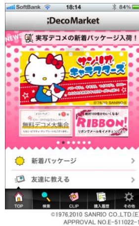
<デコマーケット TOP 画面イメージ>