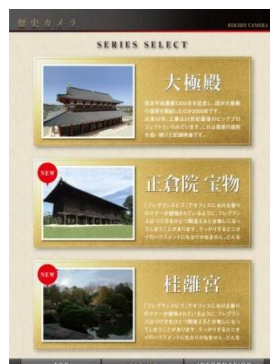
カテゴリ選択 画面