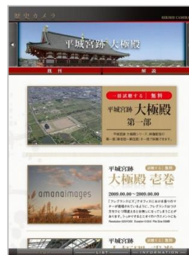
コンテンツ選択 画面