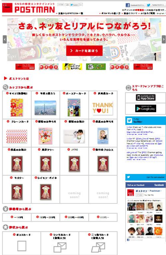
PCサイトのトップ画面イメージ